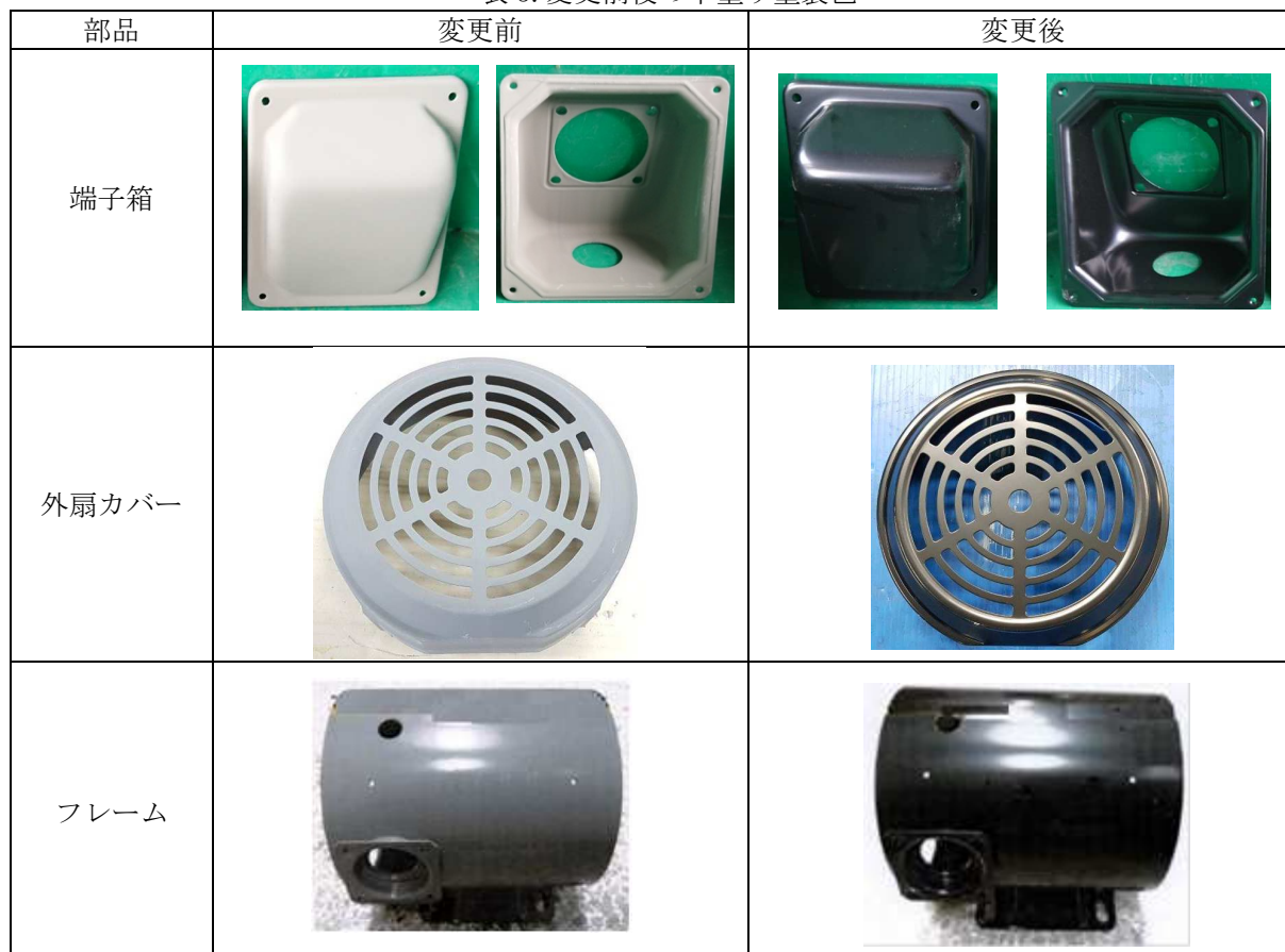
表3. 変更前後の下塗り塗装色

1項に示す機種の下塗り塗色を変更いたします。 上塗りの変更は有りませんので、モータ外観上の変更はありませんが、上塗りを行わない各部品内側の色味が変わります。なお、変更による下塗りの性能およびモータ性能の差異はありません。 変更前後の下塗り塗装色を表3に示します。