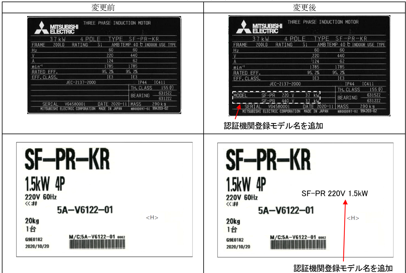
表1. 変更前後の名板・梱包ラベル比較(例)

韓国の通関管理強化に伴い、当該機種において表1のとおり名板、梱包ラベルの表示内容を変更します。