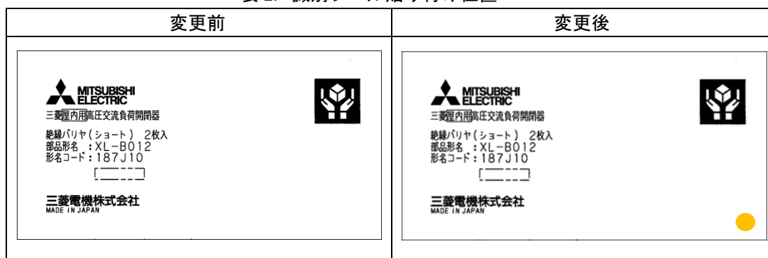
表 2. 識別シール貼り付け位置