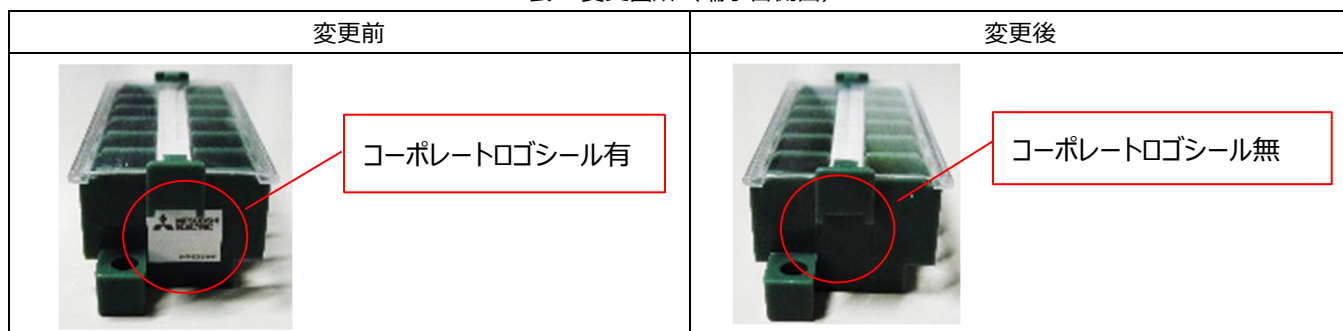
表 1. 変更箇所 (端子台側面)