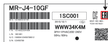
図2. 梱包ラベルへの印字例