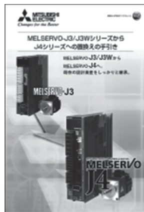
■MELSERVO-J3/J3WシリーズからJ4シリーズ への置換えの手引き L(名)03126

MR-J4シリーズのカタログです。 サーボアンプ・サーボモータ・オプション などを記載しています。