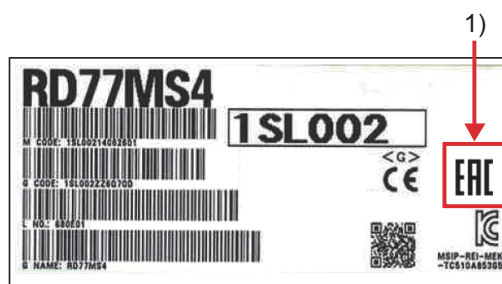
図2. 梱包ラベル表示例 (RD77MS4)