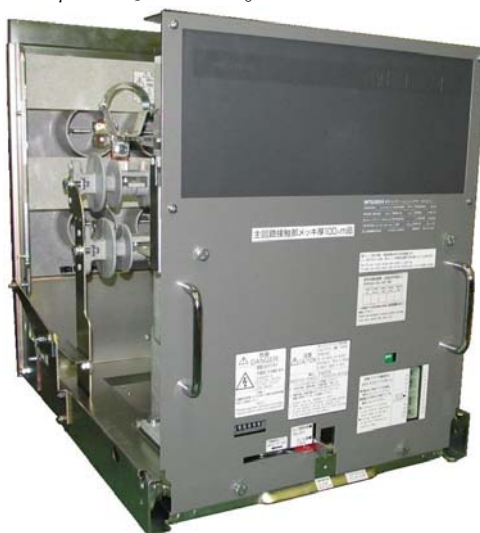
図1 高圧真空コンビネーションユニット VZ-E シリーズ ブッシングタイプ引出形