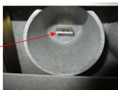
図2 銀メッキ 100\mu\text{m} の箇所