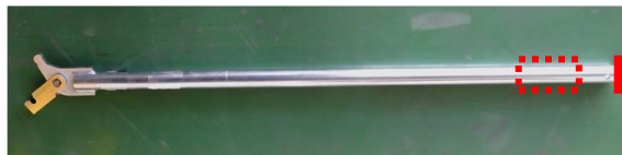
図1 挿入／引出ハンドル銘板貼付位置

挿入／引出ハンドル貼付銘板が和文のみの表記から、和英併記の表記へ変更となります。