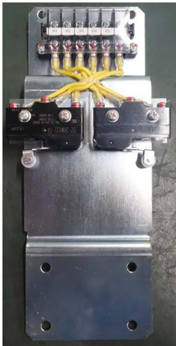
変更前(アズビル製)