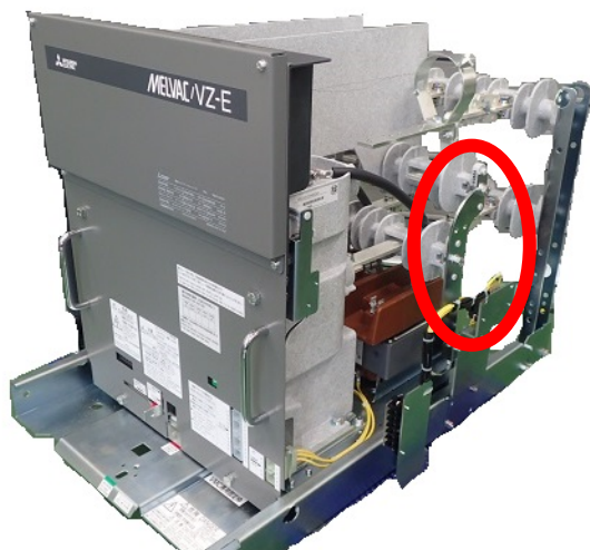
図1 支え板取付位置(例:VZ2-ECS)

上記対象機種の両側面に使用しております、支え板の先端部構造を組立作業改善のために変更いたします。