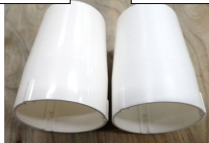
図 2.主回路端子管(外観)