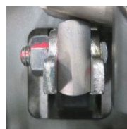
図3. 変更後(○部拡大):四角形