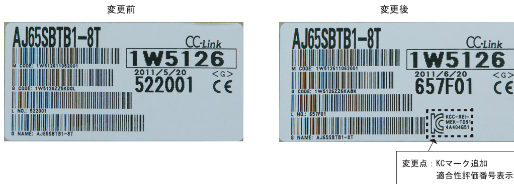
図2. 梱包箱へのKCマークと適合性評価番号の記載例