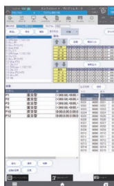
▲プログラムモニタ