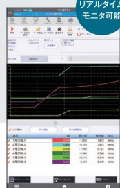
▲オシログラフ機能※ ※CR800-R/Qコントローラ、CR860-R/Q コントローラではご使用できません。