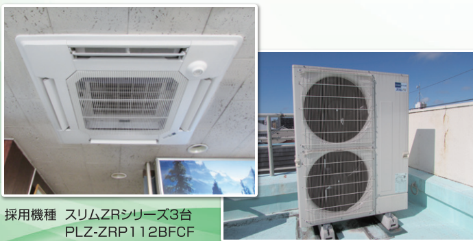
採用機種 スリムZRシリーズ3台 PLZ-ZRP112BFCF