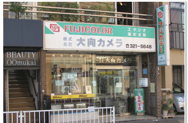
神奈川県横浜市 株式会社 大向様