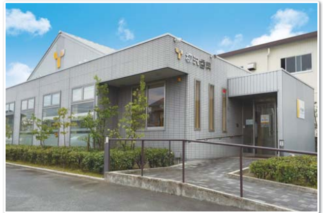
静岡県浜松市 柳沢歯科様

浜松で開業して15年。清潔感あふれ、小児専用の処置室を完備するなど患者様に配慮した治療を行う柳沢歯科様。スリムZRの省エネ性、インテリアに調和したパネルデザインと人感ムーブアイ360の快適性に満足いただきました。