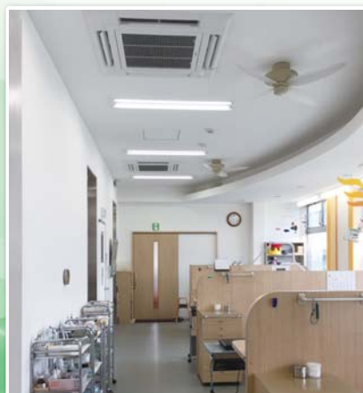
4方向天井カセット形〈ファインパワーカセット〉

エアコンを止めたときにリモコンへ表示されるCO 2 排出量。診療後、1日のCO 2 排出量を確認するようになり、省エネ意識が向上。