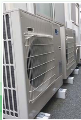
採用機種 スリムZRシリーズ2台 PLZ-ZRP80EFG