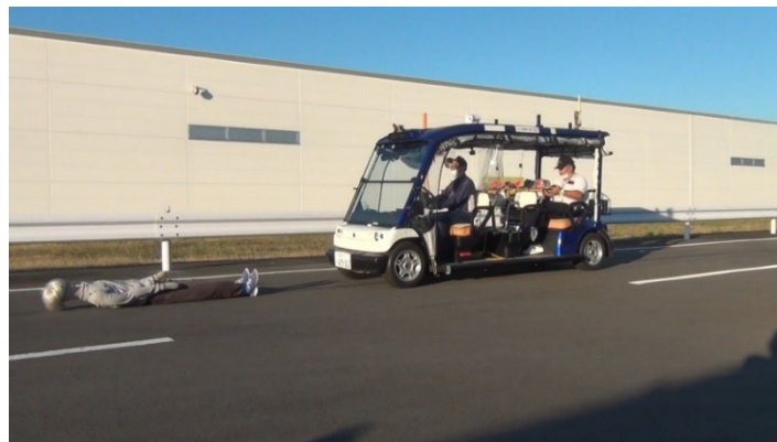
自動ブレーキの評価の様様