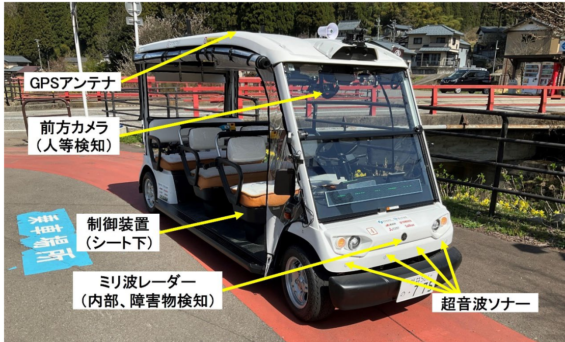
当社の主な自動運行装置の構成

三菱電機株式会社は、RoAD to the L4 *1 プロジェクトにて、自動運転移動サービスの実現に向けた実証実験に参画しています。このたび、当社が道路運送車両法に基づき開発した自動運転の制御装置が搭載された、国内初 *2 のレベル 4 *3 遠隔型自動運転システムによる無人自動運転移動サービスの車両が、福井県吉田郡永平寺町で 5 月 21 日に運行開始 *4 され、同日、レベル 4 自動運転移動サービスの開始に係る記念式典が開催されました。