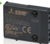
无线局域网通讯模块 GT25-WLAN