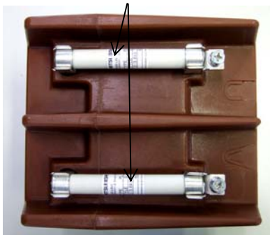
PD-50HF 形の代表例 VT一次側ヒューズの定格名板