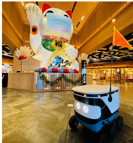
イオンモール常滑での配送イメージ

今後、配送オペレーションのさらなる最適化を進めることで、新たなカスタマーエクスペリエンス（CX）の創造を具現化し、リアルモールの魅力向上に努めてまいります。