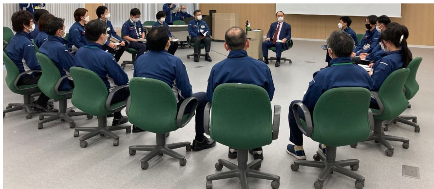
通信機製作所にて実施 (2022年4月15日)