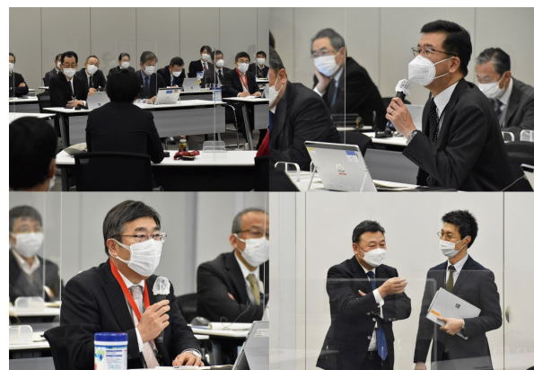
執行役・上席執行役員への説明会 (2022年2月18日)