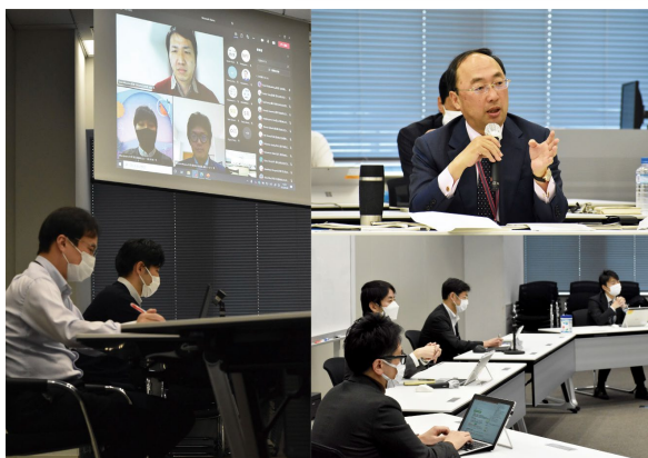
全社変革プロジェクトStep2報告会 (2022年2月8日)