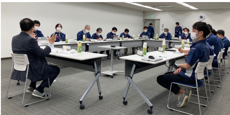
パワーデバイス製作所にて実施 (2022年4月12日)