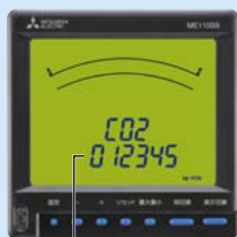
CO 2 排出量