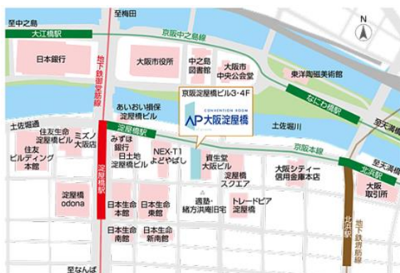
地下連絡通路ご案内図