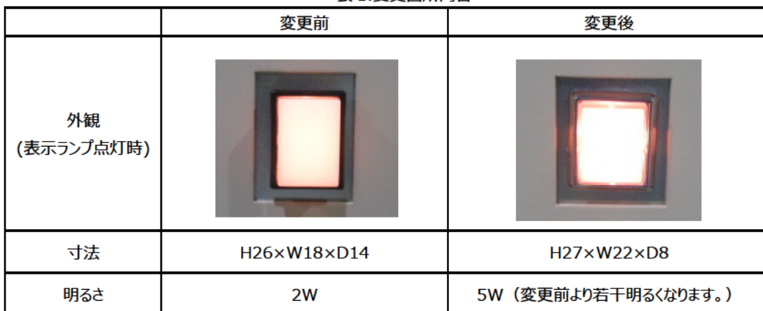
表 1. 変更箇所内容

※表示ランプ：操作ハンドル挿入時に操作可能になったことを外部表示するためのランプ。