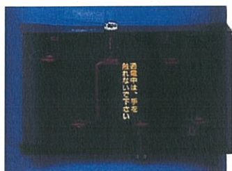
タップ切換部保護カバー(黒色)