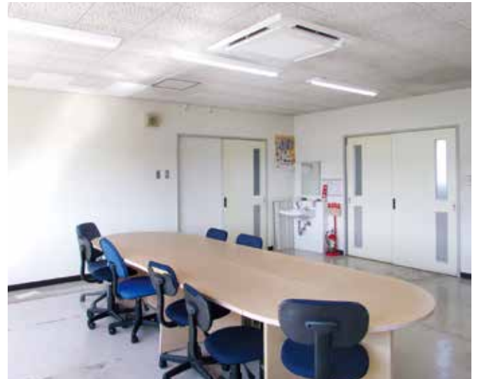
▲「ぐるっとスマート気流」で、温度ムラを解消して快適に。