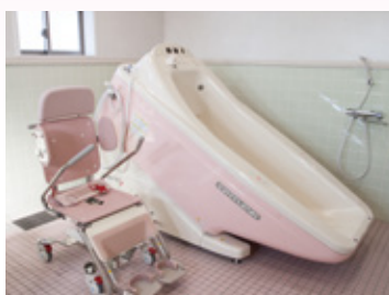
介護が必要な方も快適に使える機械浴槽