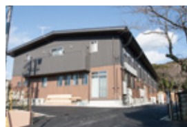
居室は約18㎡で全24室(1階9室、2階15室)。ベッドの上部にあたる箇所に循環ファンを設置