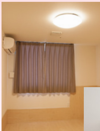
照明は温かみのある電球色で落ち着ける

設置場所はエアコンの airflow をうまく活用できるように工夫しました。当面は弱ノッチで24時間運転の予定です。