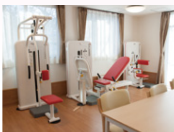
機能訓練ができるデイサービスを併設