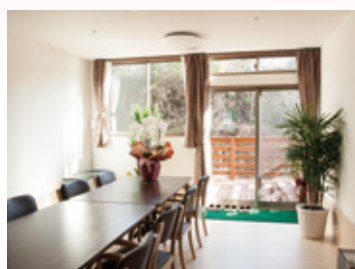
ウッドデッキを備えた1階の食堂