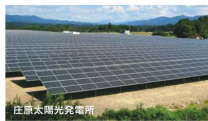
庄原太陽光発電所

広島県では、県と中国電力グループが共同してメガソーラーの発電事業に取り組んでいます。発電事業によって得られる収益は地域に還元し、地域の省エネ活動や省エネ設備導入の補助金として活用されます。ここ川尻光幼稚園でも、省エネ型エアコンと太陽光発電システムを補助金によって導入。学習環境の向上だけでなく、子どもたちの環境に対する想いも育んでいます。