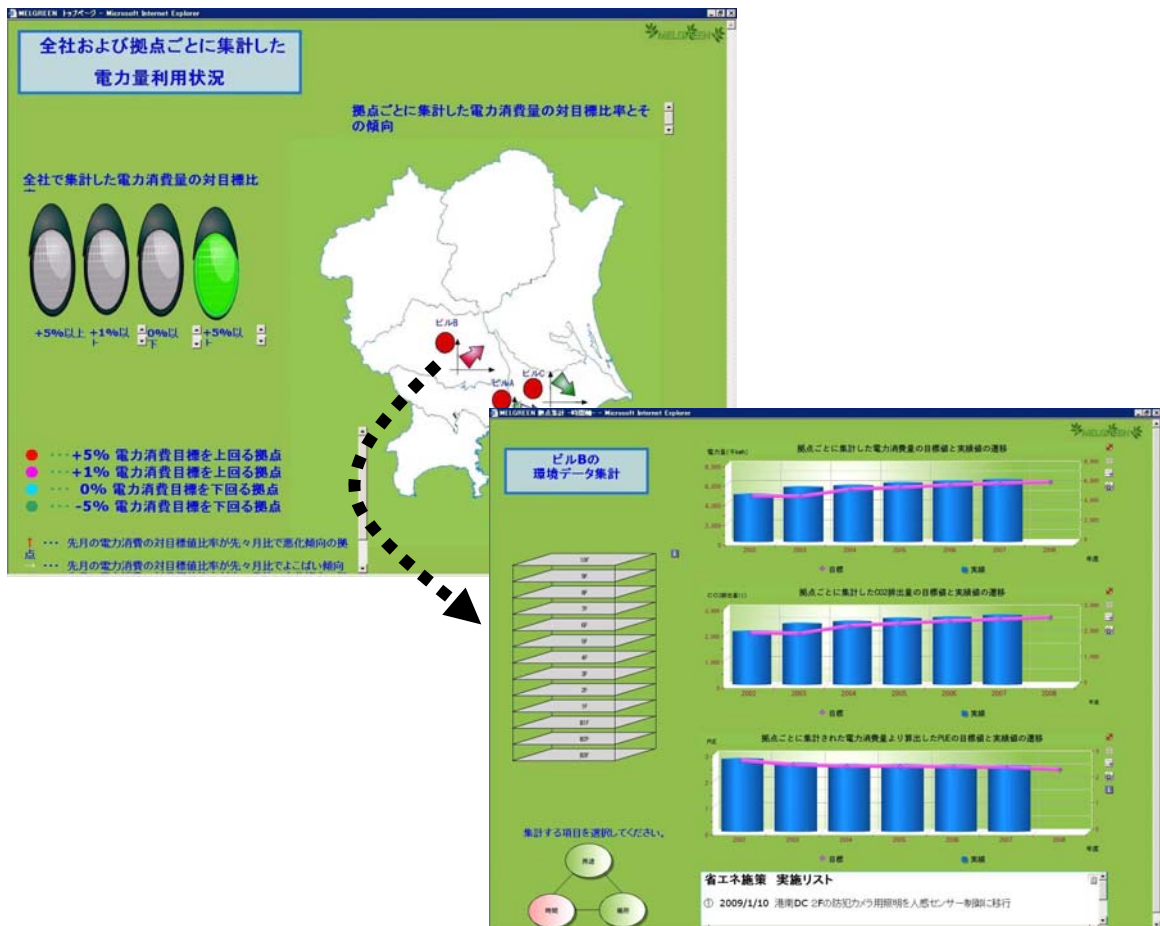
図2 見える化の表示例