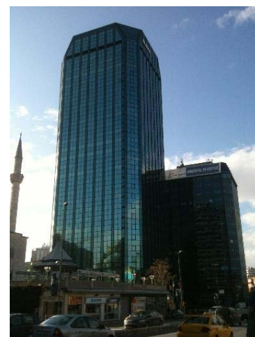
三菱電機トルコ (本社) が入居する Maya Akar Center ビル