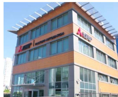
三菱電機トルコ FA センターが入居する Ümraniye 支店