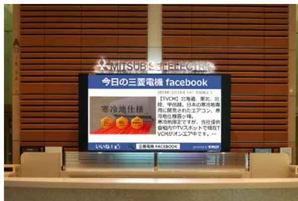
コンテンツ表示イメージ