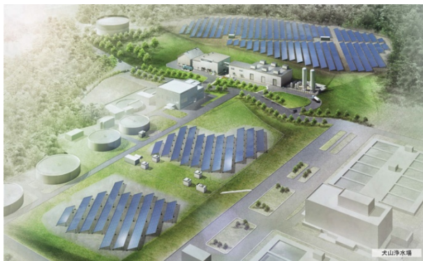
犬山浄水場 脱水および発電設備 完成予想図

尾張W&Eは、2017年3月末までに施設を設計・建設し、2017年4月から2037年3月末までの20年間にわたり同施設の運営・維持管理を行っていく予定です。