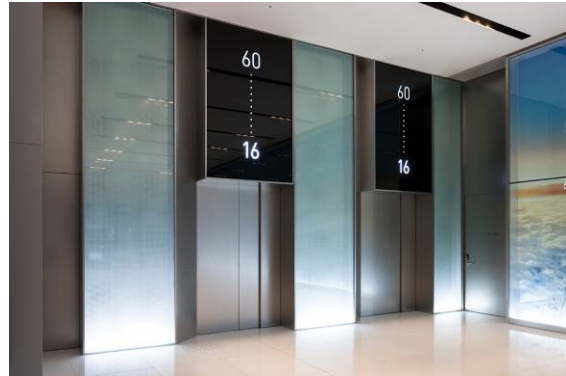
展望台行きエレベーター乗場