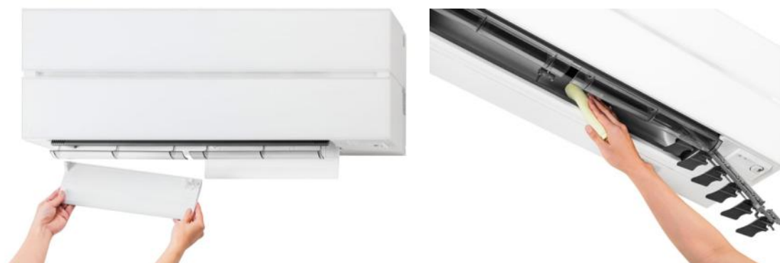
図7 はずせるボディのイメージ

新開発の「お掃除アシスト」機能を搭載した「はずせるボディ」を新たに採用しました。運転停止中にリモコンの「お掃除アシスト」ボタンを押すと、自動で外観のフラップが開き、格納式フラップが前方に出てきます。より簡単にフラップや室内機の中まで掃除でき、清潔を保ちます。また、お手入れの難しいエアコン内部の熱交換器・ファン・通風路には当社独自 ※2 の「ハイブリッドナノコーティング」を施し、ホコリなどの付着を抑制して清潔を保ちます。