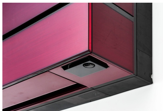
図6 格納された「ムーブアイ極」(停止時)