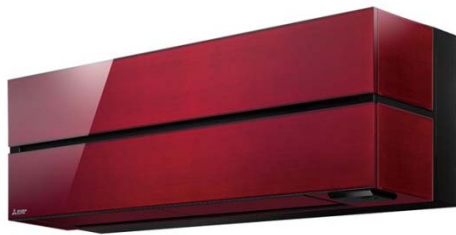
FL シリーズ(ボルドーレッド)

三菱電機株式会社は、ルームエアコン「霧ヶ峰」の新シリーズとして、部屋のインテリアに調和する洗練されたデザインでエアコンの新しいスタイルを提案するとともに、省エネ・快適を実現した「霧ヶ峰 Style (スタイル) FL シリーズ」6機種を3月下旬に発売します。