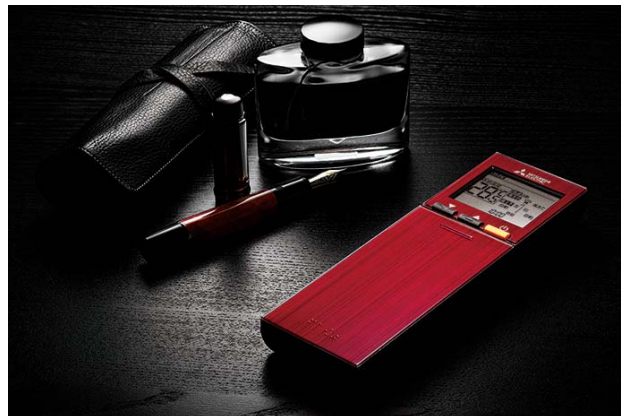
図4 ヘアライン柄を施した「スタイリッシュリモコン」