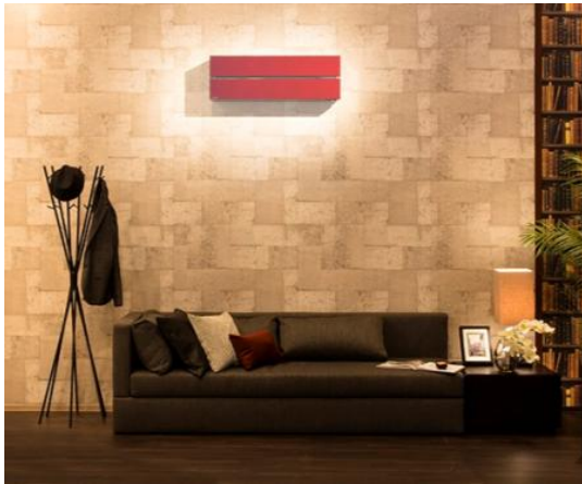
図2 FLシリーズ（ボルドーレッド）設置例