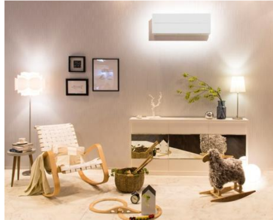
図3 FLシリーズ（パウダースノウ）設置例