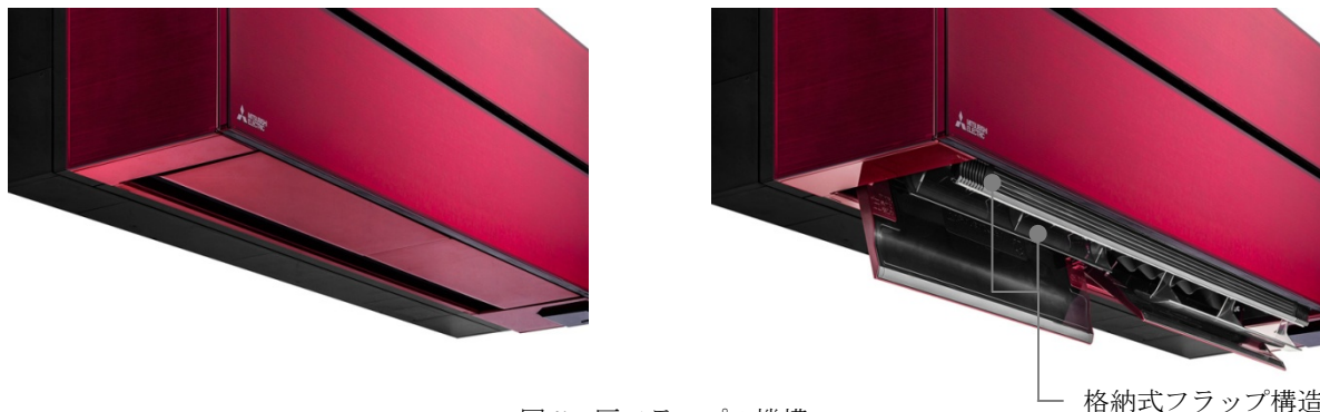
図5 匠フラップの機構

新開発の格納式フラップ構造を採用し、正面から吹出し口が見えない「匠フラップ」と、運転停止時は本体ボディに格納されるセンサー「ムーブアイ極」の搭載により、スタイリッシュなフォルムを実現しました。また、水平吹きから下吹きまでの気流を制御する「匠フラップ」の高度な気流制御と、「ムーブアイ極」で手足の先まで細かく温度を測定し冷たい足先を見つけてしっかり温めることで快適性とデザイン性の両立を実現しました。