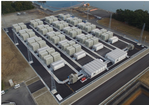
九州電力株式会社 豊前蓄電池変電所 「大容量蓄電システム」

※3：一般社団法人 新エネルギー導入促進協議会が公募した「再生可能エネルギー接続保留緊急対応補助金（大容量蓄電システム需給バランス改善実証事業）」において、九州電力株式会社が採択されたもの