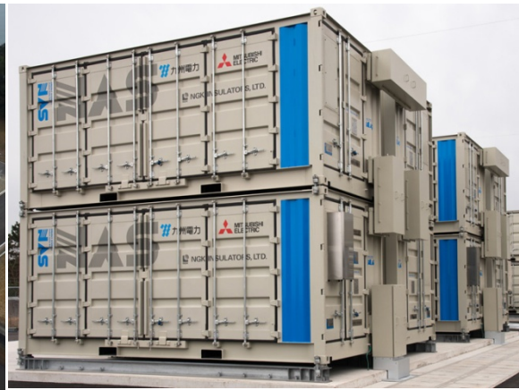
蓄電池（2段積みシステム）