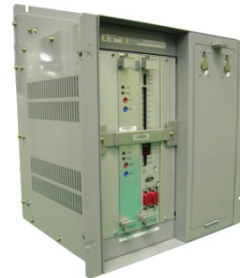
車両情報制御装置