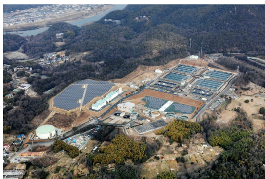
犬山浄水場 脱水・発電設備