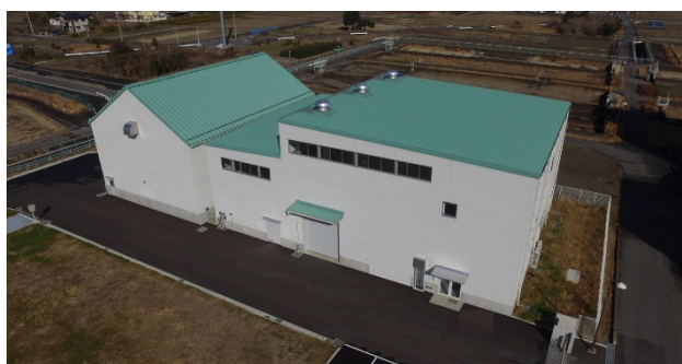
尾張西部浄水場 脱水設備