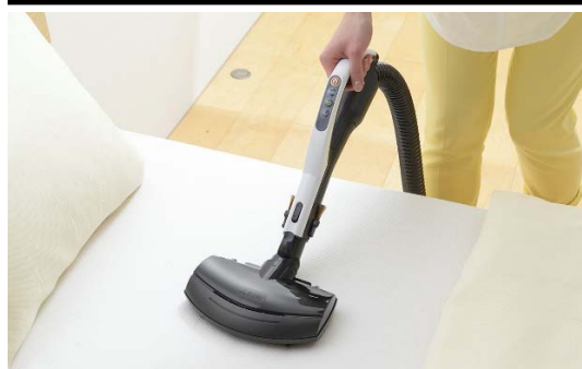
アレルパンチふとんクリーンブラシ