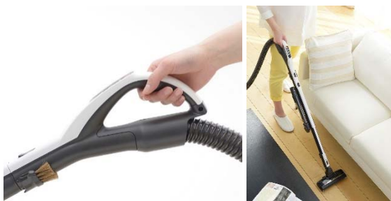
床掃除での前後の操作がスムーズ