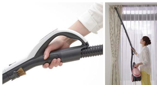
カーテンレールなどの高所掃除に