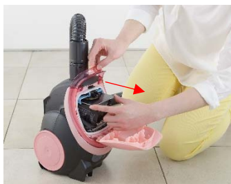
紙パック専用レール