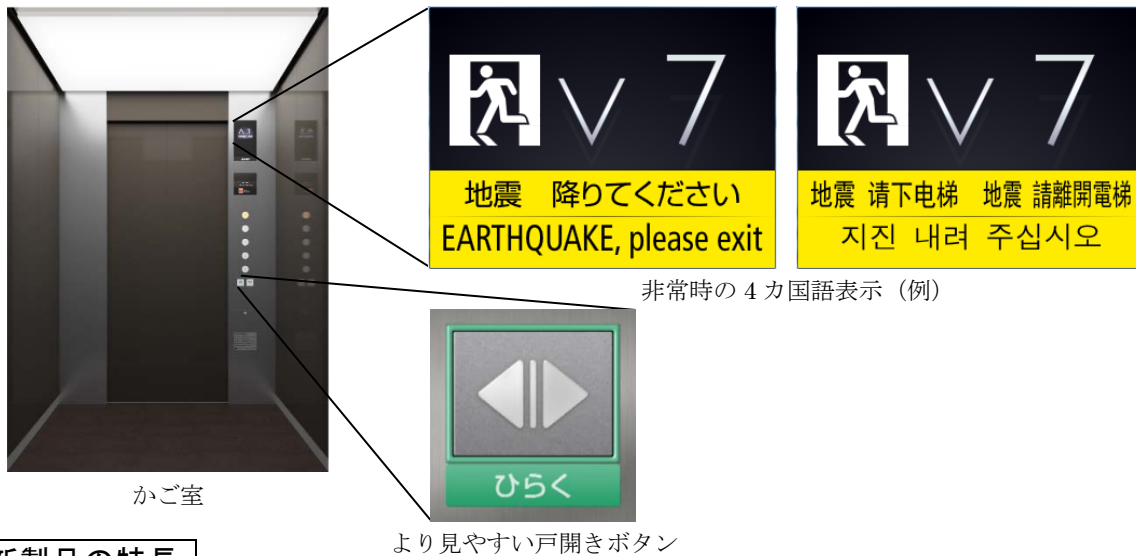
非常時の4カ国語表示（例）

※3：三菱電機は東京2020大会オフィシャルパートナー（エレベーター・エスカレーター・ムービングウォーク）です。