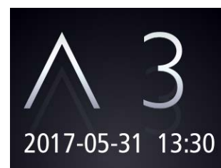
かご内液晶インジケーター