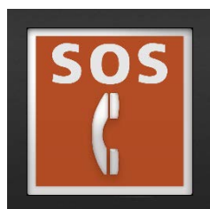
インターホンボタン

この「三菱機械室レス・エレベーター AXIEZ」は色覚の個人差を問わず、より多くの人に見やすいカラーユニバーサルデザインに配慮して作られていると、NPO法人カラーユニバーサルデザイン機構により認証されています。