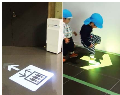
アニメーション誘導ライティング