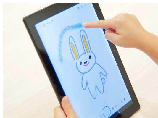
しゃべり描き UI (ユーザーインターフェース)