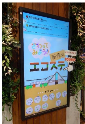
新津駅エコステ省エネモニター ※東日本旅客鉄道株式会社新潟支社との共同応募