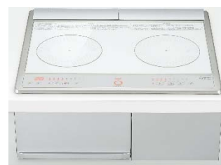
IH クッキングヒーター 「CS-G217D シリーズ」