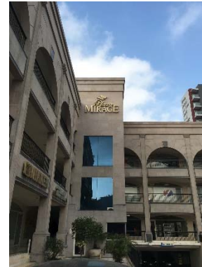
メキシコ・モンテレイ FAセンターが入居するビル