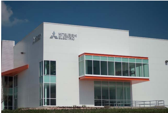
メキシコ FAセンターが入居するビル

三菱電機株式会社は、メキシコのケレタロ州に「メキシコ FAセンター」を、ヌエボ・レオン州のモンテレイ市に「メキシコ・モンテレイ FAセンター」を新たに開設し、FA機器のサービス業務を5月15日に開始します。従来の1拠点（メキシコシティ）から3拠点に増やし、メキシコにおけるFA機器サービス体制をさらに強化し、お客様の満足度向上を目指します。