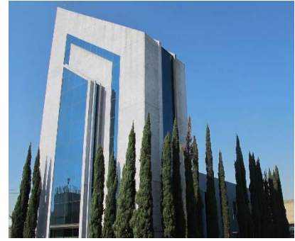
メキシコシティ FA センターが入居するビル