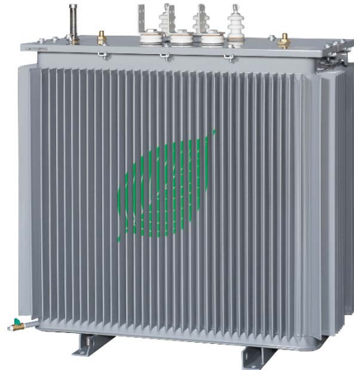
スーパー高効率油入変圧器 EX-α シリーズ

三菱電機株式会社は、工場・ビル・学校・公共機関など幅広い分野で使用される配電用油入変圧器の新製品として、三菱電機配電用「スーパー高効率油入変圧器 EX-α シリーズ」52機種を3月5日に発売します。鉄心材料にアモルファス合金を採用することで、さらなる高効率変換を実現し、省エネに貢献します。