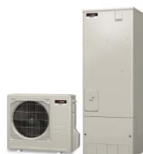
ヒートポンプユニット 貯湯ユニット