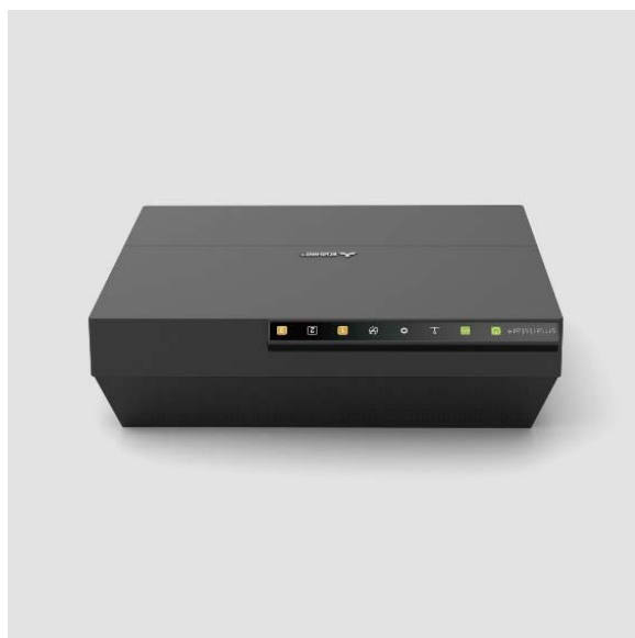
図 3：ラック内での水平設置イメージ