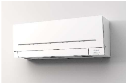
ルームエアコン MSZ-AP シリーズ