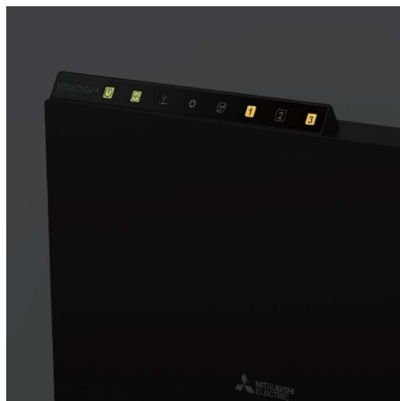
図 4：バックライトで光るピクトグラム表示