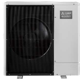
エアトウーウォーター ヒートポンプ室外機 ecodan PUHZ-AA シリーズ