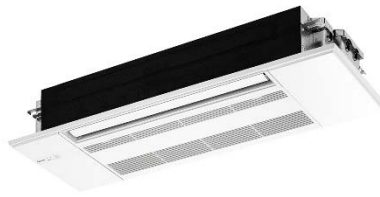
一方向天井カセット型エアコン MLZ-KP/MLZ-RX/MLZ-GX/ MLZ-HX シリーズ