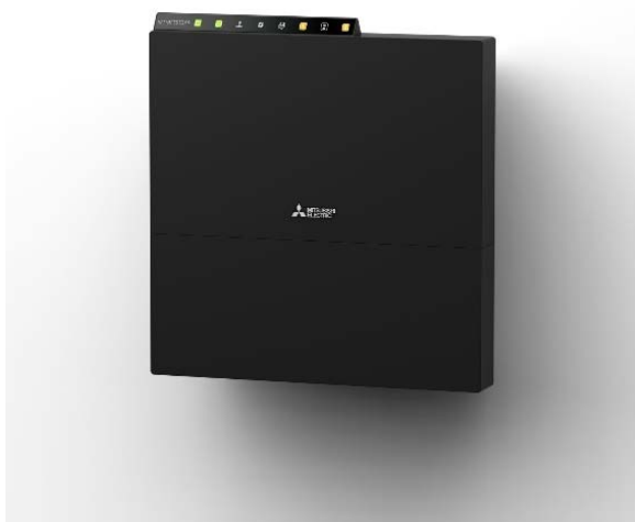
図 1：壁掛け設置イメージ

※ IEC（国際電気標準会議）が定める防水・防塵規格（IP 規格）。 IP に続く 1 桁目の数字は防塵等級を、2 桁目の数字は防水等級を表す