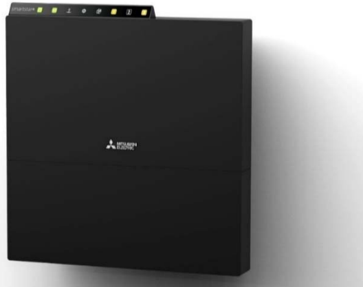
耐環境型 IoT 通信ゲートウェイ「三菱通信ゲートウェイ XS-5R/XS-5T」

三菱電機株式会社は、国際的なデザイン賞である「Red Dot Design Award (レッド・ドット・デザイン・アワード)」において、耐環境型 IoT 通信ゲートウェイ「三菱通信ゲートウェイ XS-5R/XS-5T」(2017年9月販売開始)が、プロダクト・デザイン部門の最高部門賞「Best of the Best」を受賞しましたのでお知らせいたします。「Best of the Best」の受賞は当社として初めてです。このほか、3製品が同部門の部門賞「Product Design 2018」を受賞しました。