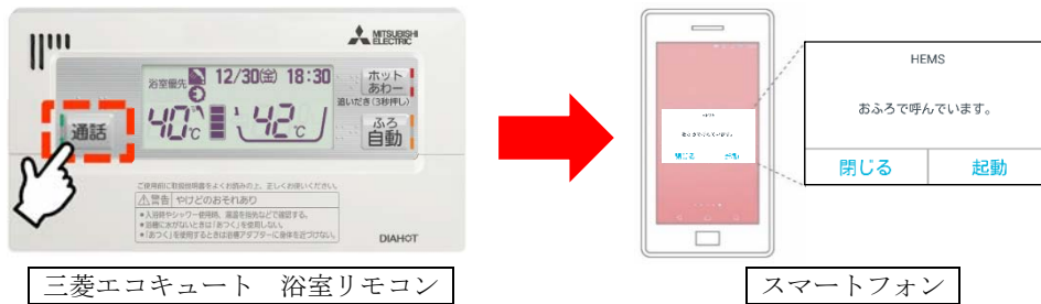
新ソフトウェアで追加される「家族見守り」機能イメージ

※1 それぞれの自動更新・アップデート予定日は10月11日に三菱 HEMS 製品サイトにて発表します