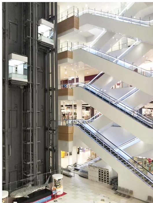
シースルーエレベーターとエスカレーター

三菱電機株式会社は、6 月 27 日にグランドオープンした「サンエー浦添西海岸 PARCO CITY」（沖縄県浦添市）にシースルータイプ 3 台を含むエレベーター13 台、エスカレーター40 台を納入しましたのでお知らせします。今回の納入を通じて、国内外からの観光客が年々増加している沖縄県の大型商業施設における安心・安全・快適な屋内移動に貢献します。