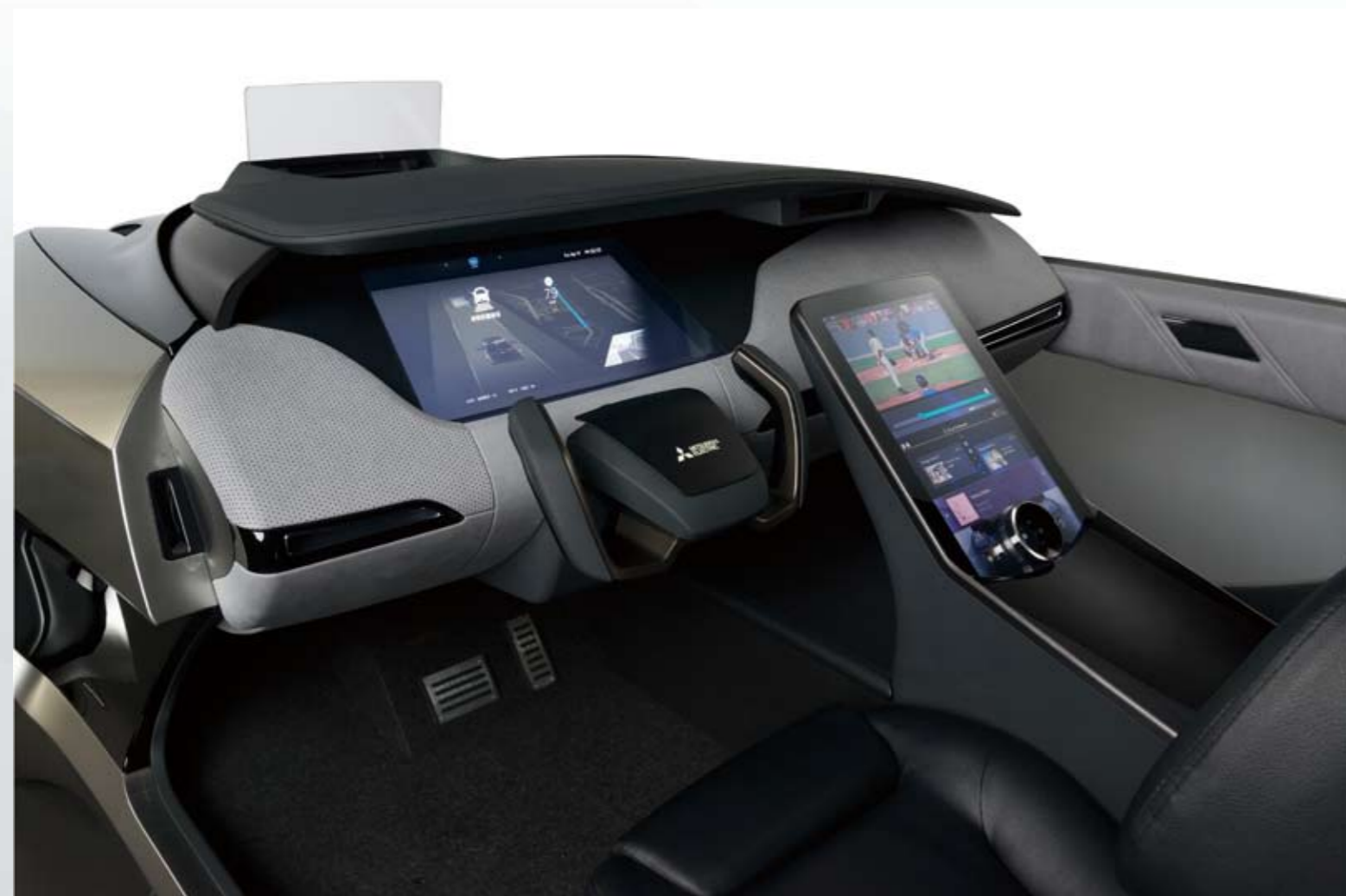
EMIRAI4 (車内) EMIRAI4 interior

The concept car represents the result of development in 3 key domains for the smart mobility era.