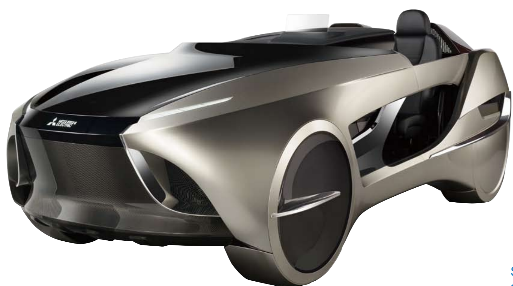
EMIRAI4 (外観) EMIRAI4 exterior

自律型・インフラ型 自動走行による安心・安全 Safety and security by stand-alone and infrastructure-based autonomous driving