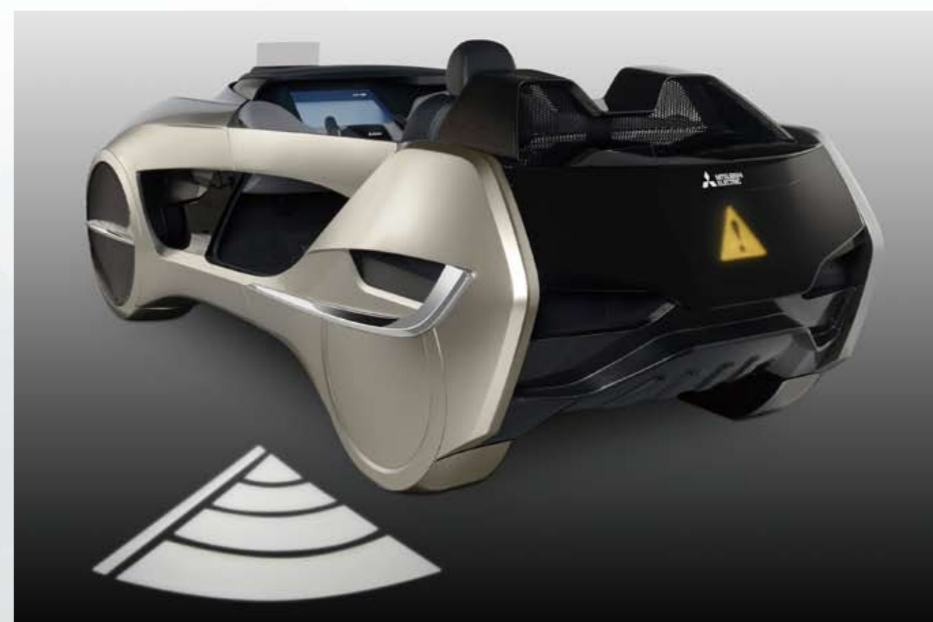
ライティング技術 Lighting system