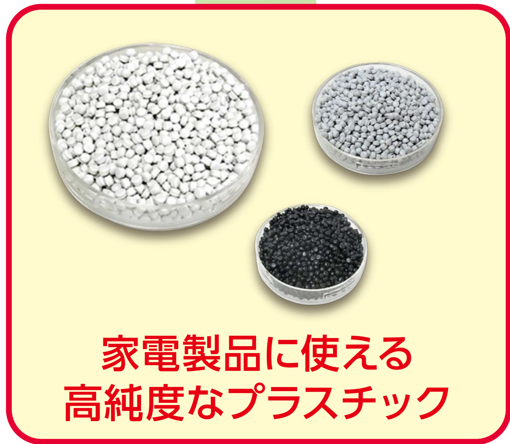
家電製品に使える 高純度なプラスチック