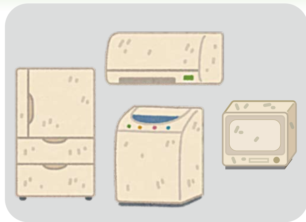
使用済の家電製品