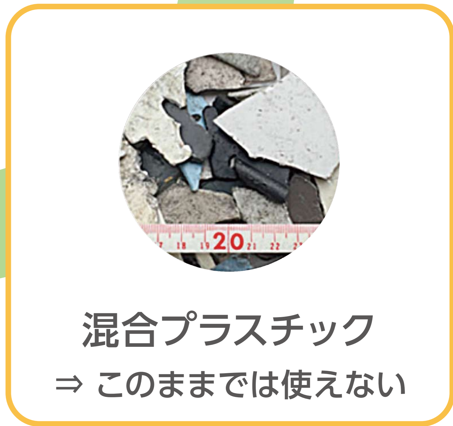
混合プラスチック ⇒ このままでは使えない

三菱電機グループの技術で、 家電製品のプラスチックを くり返し使えるようになったのね。