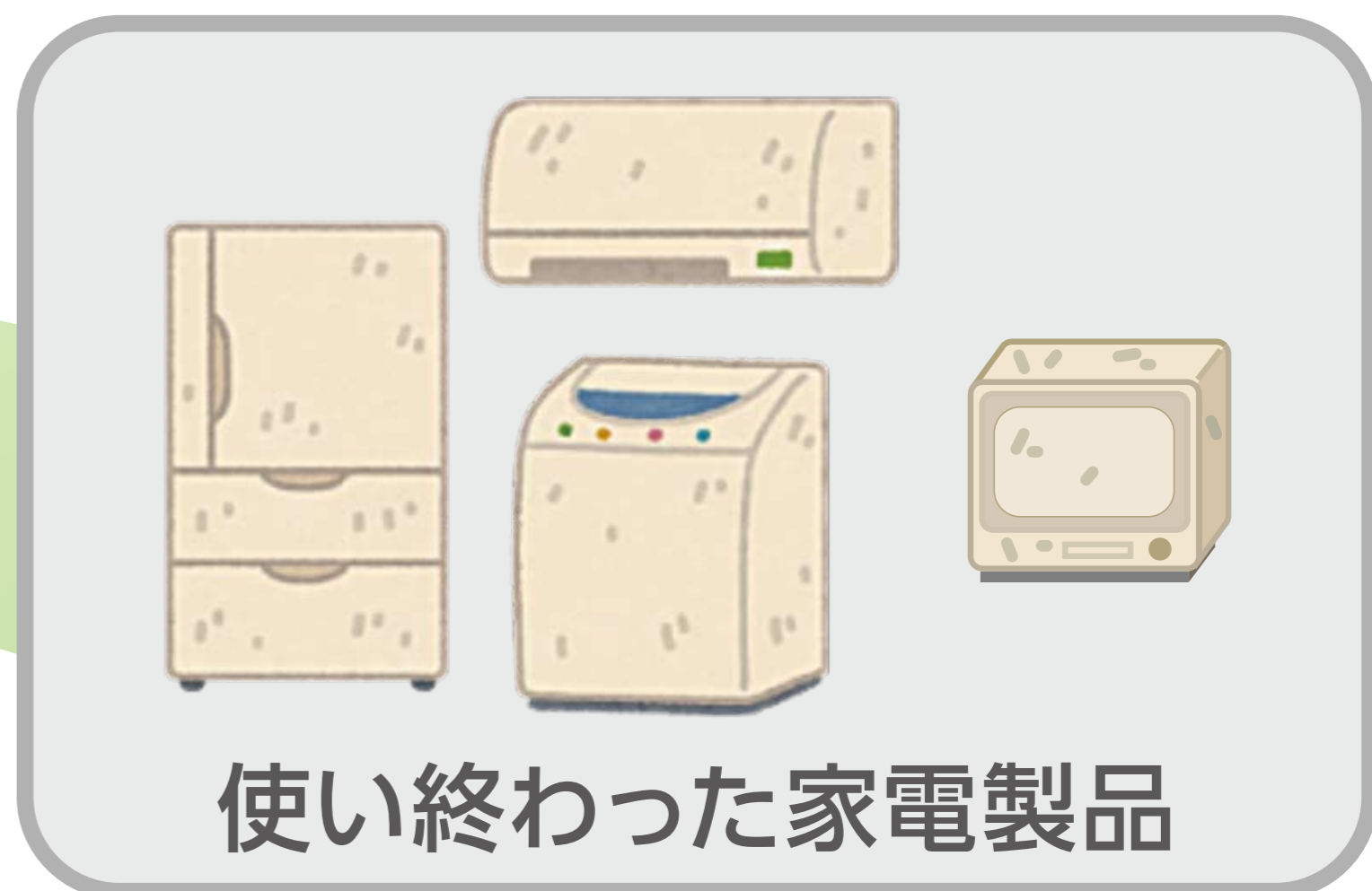
使い終わった家電製品