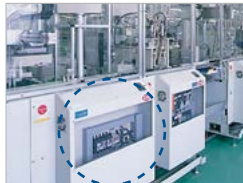
半導体製造・検査・試験装置