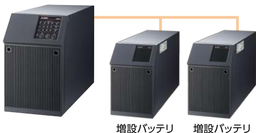
増設バッテリー 増設バッテリー